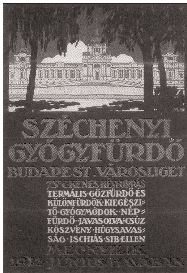
Hirdetmény a Széchenyi gyógyfürdőről

A gyógyfürdőkre és üdülőhelyekre vonatkozó feladatok mind hatékonyabb ellátása érdekében az Országos Forrás- és Fürdőügyi Bizottságot újjászervezték, amelybe a Népjóléti és Munkaügyi Minisztérium, az Országos Közegészségügyi Tanács és a nagyobb biztosítótársaságok küldötteit delegálták. A szervezet elnöke személyesen a népjóléti és