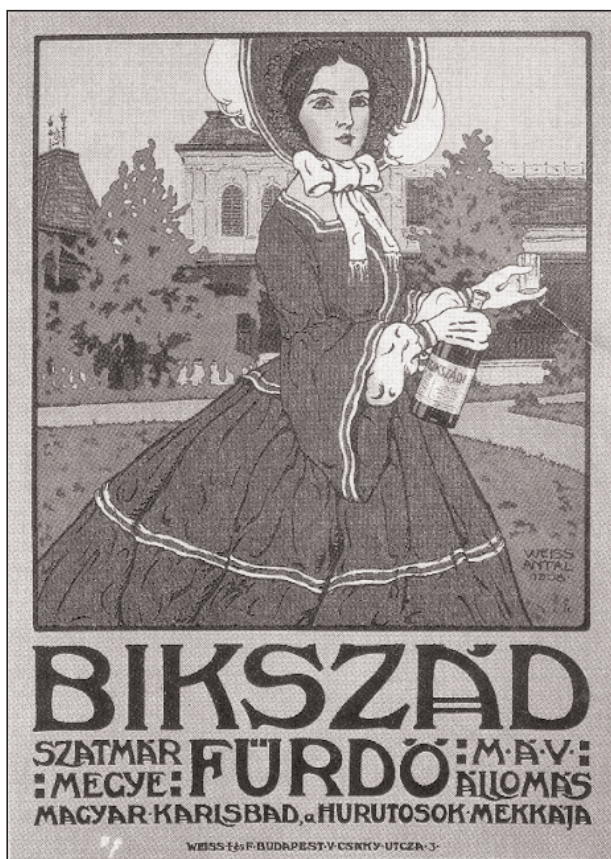
Weiss Antal: Bikszád fürdő. Plakát

Chyzer Kornél (1836–1909) került a Belügyminisztérium egészségügyi főnöki tisztjére, aki az ásványvizekre és gyógyfürdőkre vonatkozó hatályos jogszabályokat összefoglalta (2) s ezzel a fürdőkultúra XX. századi fellendülésének alapjait lerakta.