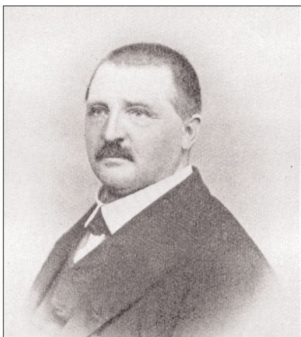
Anton Bruckner 44 éves korában

Nemigen túlzunk, ha azt állítjuk, hogy a zenetörténet jelentős alkotói közül Bruckner önbizalma, önértékelése állt a leggyengébb lábakon. Más szerzők is voltak, akik újra és újra revideálták műve-