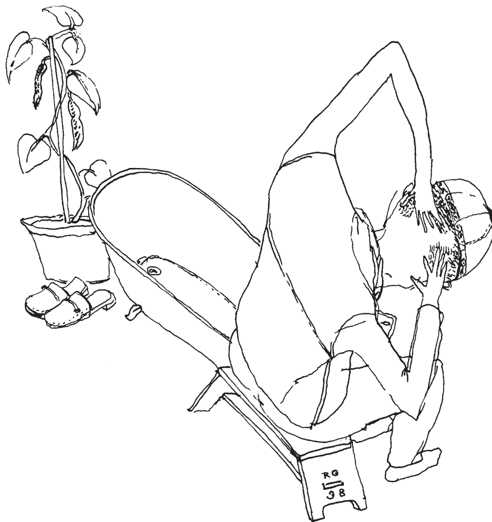
Roskó Gábor grafikája