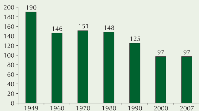
Élveszületések száma Magyarországon (ezer fő) 1949–2007 között