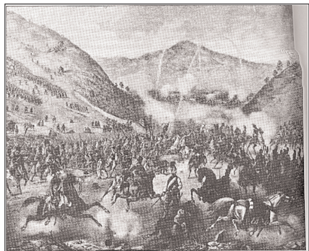
A pákozdi csata