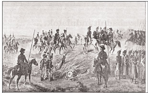
A világosi fegyverletétel