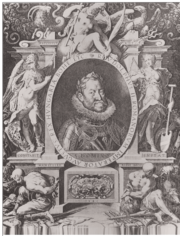
Egidius Sadeler: II. Rudolf képmása. Rézmetszet

V. Károly egyébként maga is Németalföldön, a flandriai Gentben született. Lényegében itt nőtt fel, császárrá választása után azonban mind kevesebb ideje maradt arra, hogy személyesen igazgassa e szívéhez oly közel álló területet. Ekkor kapott szerepet az ország irányításában a Habsburg-família két