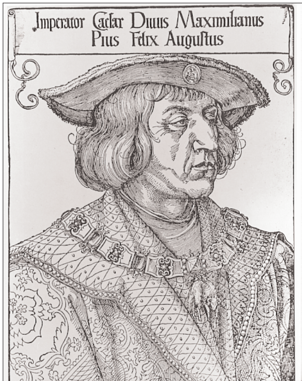
Albrecht Dürer: I. Miksa képmása. Fametszet

férfi tagjától. A gyermek kezében tartott papírlap felirata elárulja, ki is ez a kakukktojás... Nem más, mint a Jagelló-családból származó, nem sokkal később magyar királlyá választott, majd Mohácsnál fiatalon elesett II. Lajos (1506–1526). Így érthetőek a jelentős fiziognómiai eltérések! II. Lajos gyermekien lágynonásaival összevetve kétségkívül még inkább szembetűnnek a Habsburg fiúk markáns családi jellegzetességei, a horgas orr, az előreugró alsó állkapocs, illetve a duzzadt ajkak, amelyeket majd a família számos későbbi képviselőjénél is megfigyelhetünk. De mi keresnivalója van az ifjú Jagellónak ezen a Habsburg-családi portrén?