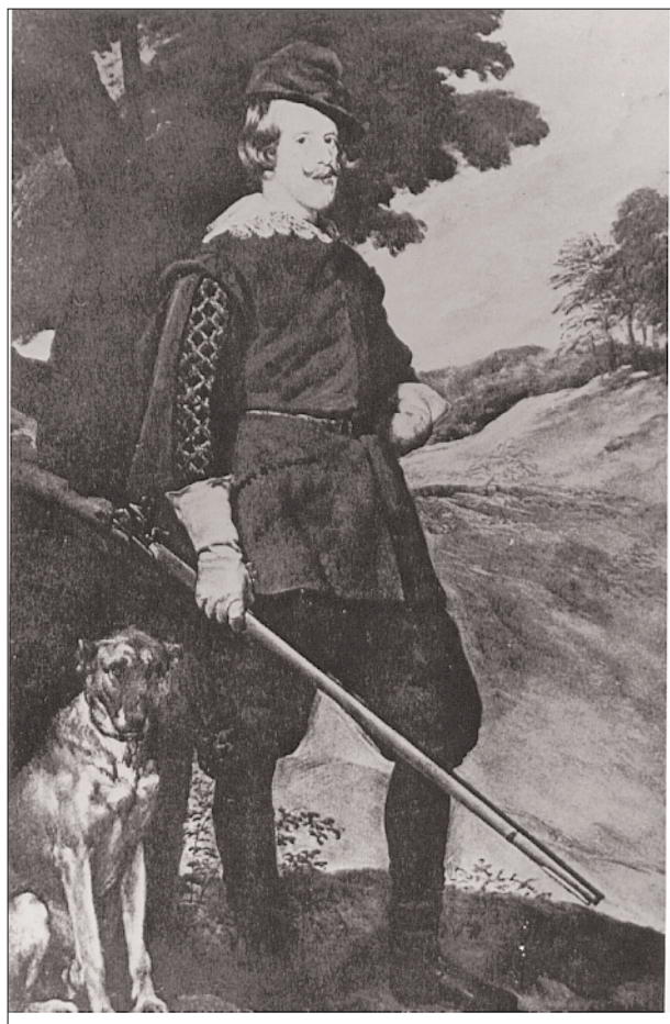
Diego Velázquez: IV. Fülöp képmása. Prado, Madrid