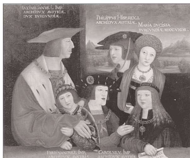
Bernhard Strigel után: I. Miksa császár családtagjai körében

Kiváló lehetőséget nyújt a família több, jól ismert képviselőjének ilyen szempontú összehasonlítására a sváb származású Bernhard Strigel (1460–1528) 1515 táján készült, s jelenleg a bécsi Kunsthistorisches Museumban őrzött csoportképe, amely I. Miksa császárt (1459–1519) örökíti meg családtagjai körében. A több változatban is fennmaradt festmény bal oldalán, profilból látható maga a császár, aki védő mozdulattal öleli magához fiatalabb unokáját, a szemből ábrázolt I. Ferdinándot (1503–1564). Tőlük jobbra, egy tájra nyíló ablaknyílás előtt, Miksával ellentétes beállásban tűnik fel az uralkodó mintegy tíz évvel korábban elhunyt fia, Szép Fülöp (1478–1506), míg kettőjük között