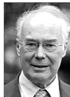
Sir Martin J. Evans

sára is képesek voltak. Ez utóbbi esetben a két különböző állatból eredő embrionális sejtek, egy nevelőanyagban felnöve, mozaikegeret eredményeztek, amelynek szövetei a két különböző tulajdonságú sejt keverékeként alakultak ki. Az ilyen mozaikállatok további keresztezésével létrehozható az ismert sejtvonallal genetikai állományát tisztán hordozó egér.