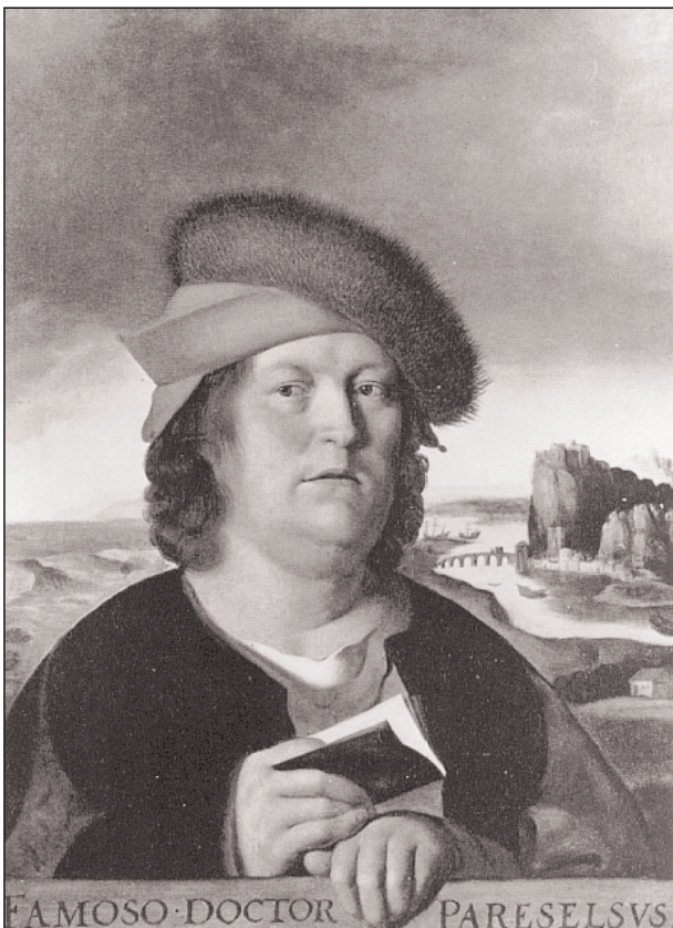
Peter Paul Rubens: Massys után, Paracelsus portréja. Brüsszel, Musées Royaux des Beaux-Arts

lyen egy pénzérméket mérő bankárt láthatunk imakönyvet lapozgató felesége társaságában. A fiatal pár mögötti polcon különféle könyvek és használati tárgyak sorakoznak, míg az asztalon az előtérben egy domború tükröt fedezhetünk fel, amelyben a szoba egyébként nem látható ablakai tükröződnek. Ez a fajta illuzionizmus persze nem számított teljesen újnak a németalföldi festészetben, hiszen már egyes korábbi mesterektől, így például Petrus Christustól is ismerünk hasonló jellegű műveket, a szobabelső visszautkrözőző domború tükör motívuma pedig végső soron Jan van Eyck híres alkotásáig, az Arnolfini házaspár ig vezethető vissza. Ami Quentin Massys szóban forgó képén leginkább megfog benünket, az nem is annyira az egyes részletek finom kidolgozása, mintsem a jelenet rendkívül közvetlen, bensőséges hangvétele.