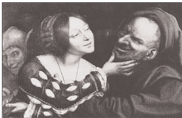
Quentin Massys: Össze nem illő pár. Washington, National Gallery of Art

Térjünk azonban vissza a Paracelsus-képmás alkotójához, Quentin Massyshez, aki a maga módján, németalföldi pályatársaihoz hasonlóan, szintén nagy hangsúlyt fektetett a természet tanulmányozására. A már említett portrékon kívül, a festő más műfajba tartozó alkotásai, így hangulatos életképei is kiváló megfigyelőkészségről és jellemábrázoló képességről tesznek tanúbizonyságot. Jól példázta ezt az az 1514-ben készült, s jelenleg ugyancsak a párizsi Louvre-ban található csodálatos festmény, ame-