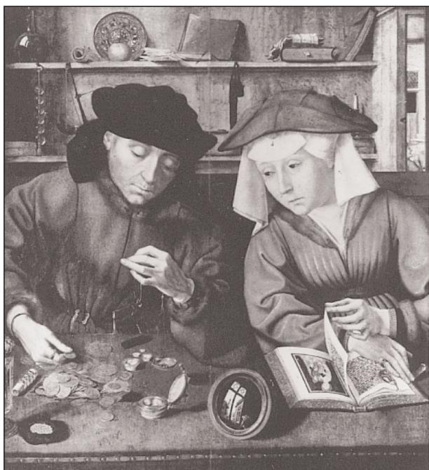
Quentin Massys: A bankár és felesége. Párizs, Louvre

gyógyászat területén működő Paracelsus érdekel, akinek ellentmondásos figuráját, illetve munkásságát az elmúlt évszázadok során igen eltérően értékelték.