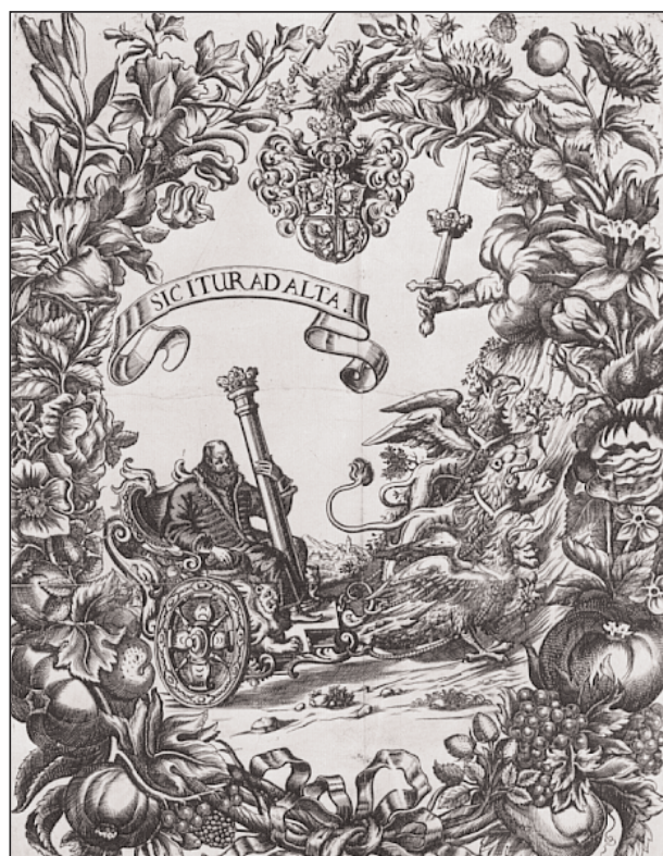
Christian Roth von Rothenfels: Weber János apoteózisa. Metszet

Weber János diadalszekerét három „királyi” erényt képviselő állat húzza: a griff az éberség és az iparkodás, az oroszlán a nagylelkűség és mértéktartás, a sas pedig a kegyesség és okosság, illetve az éleslátás szimbóluma. A tekintéllyel és tisztelettel megkoronázott állhatatosság, azaz a koronás oszlop vagy a kard szintén bekerültek az ábrázolás alkotóelemei közé. A kocsit két oldalán lévő szfinxek arra utalnak, hogy a bölcsesség (itt a főbíró bölcsessége) minden kétértelmű, kényes ügyre megtalálja a megoldást. A gyümölcsökkel, virágokkal, növényekkel borított keret a békére utal, amely a bíró tevékenységének köszönhetően felvirágoztatta a várost. Ezen belül a rózsza a tisztaság, őszinteség és türelem jelképe, a liliom a remény és a jóra való várakozás szimbóluma. A mák és az eper a termékenységre